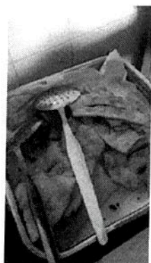
Tradições de Carnaval (fevereiro 2020)