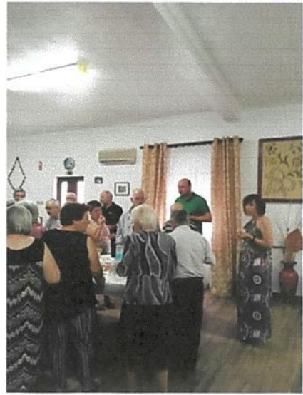
Tasquinhas dos Avós