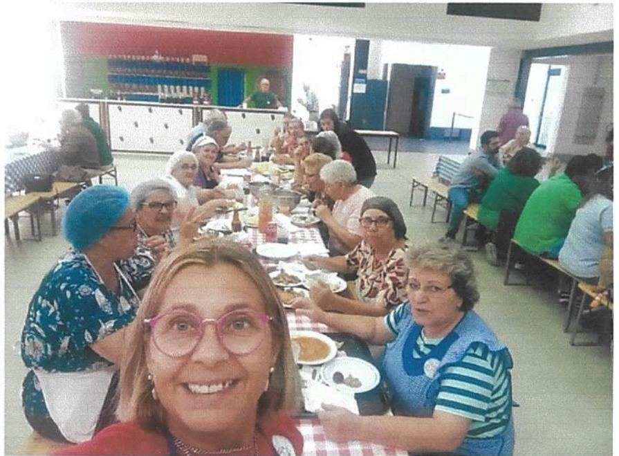
Festa de S. Martinho