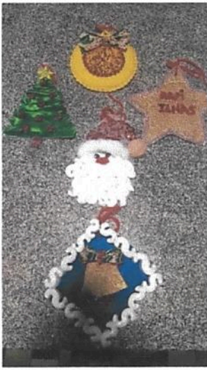
Trabalhos Manuais – Natal