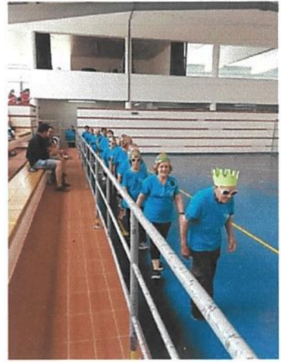
Participação Projeto Viver Sênior