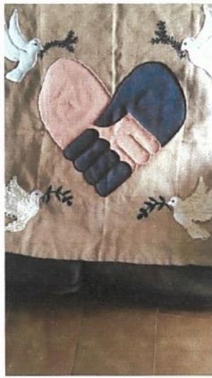
Trabalhos Manuais – PAZ