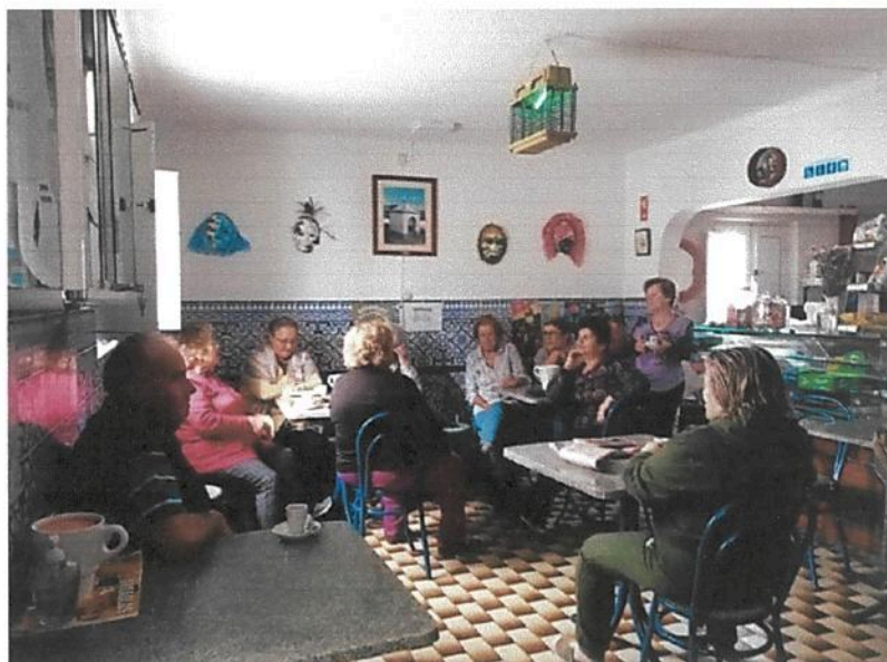
Convívios variados na sede