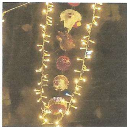
Participação na decoração de natal